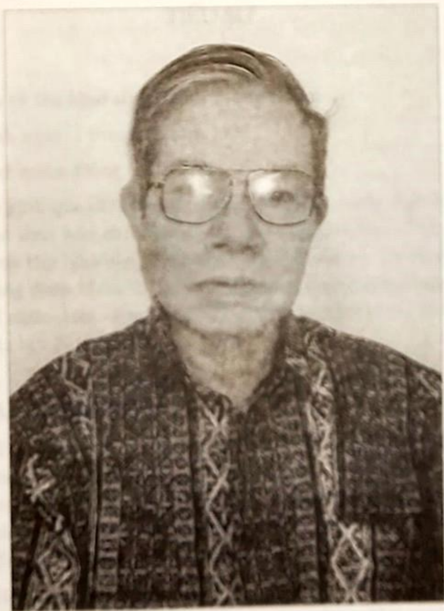
Nhà văn MA VĂN KHÁNG